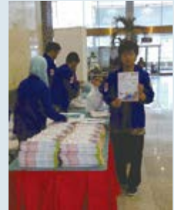
JASSO主催「日本留学フェア」 ジャカルタ会場で（2017年10月）